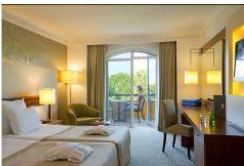
Haupthaus Doppelzimmer Standard