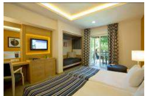
Village Doppelzimmer Standard