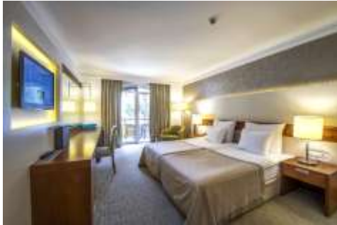
Haupthaus Doppelzimmer Standard